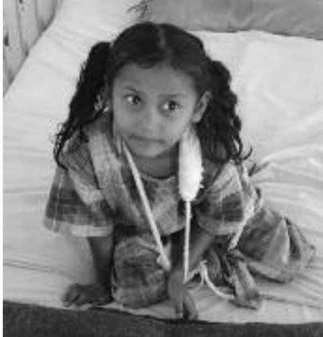
Kleine Patientin im Krankenhaus

Mein Projekt war zweigeteilt. Zunächst arbeitete ich an einem orthopädischen Krankenhaus für Kinder aus bedürftigen Familien. Die jungen Patienten kommen mit körperlichen Fehlstellungen, die entweder angeboren oder durch mangelhafte medizinische Versorgung nach Unfällen zustande kommen, aus allen Teilen des Landes. Häufig handelt es sich um Krankheiten wie den Klumpfuß, die in industrialisierten Ländern sofort nach der Geburt erfolgreich diagnosti-