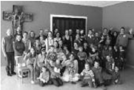
15 Familien haben sich im Josefstal auf die Suche nach den je eigenen Sehnsüchten und Hoffnungen gemacht