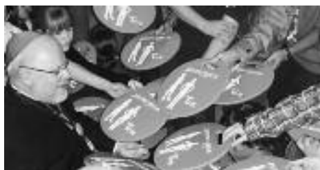
Erzbischof Marx gibt Autogramme auf Sitzkissen

schen aus unserem Dekanat und der Pfarrei St. Benno, diskutierten am 14.11.2009 auf dem Jugendforum unter dem Motto „Update Kirche“ auf dem Freisinger Domberg.