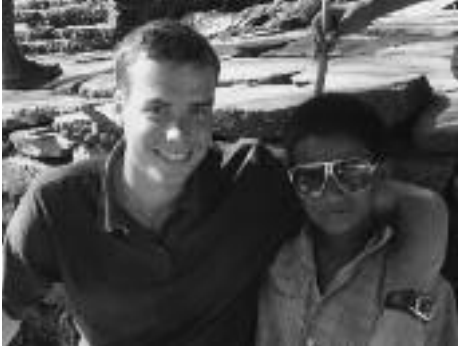
Bei einer Wanderung