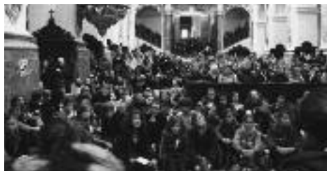
Jugendkorbinian im Freisinger Dom

zu machen und zum „Heutigwerden der Kirche“ beizutragen. „Auch ich als Bischof bin immer wieder aufgerufen, um den richtigen Weg zu ringen“, so Marx. Im Anschluss an den Gottesdienst standen Aktionen, Diskussionsrunden und Mitmachaktionen auf dem Programm.