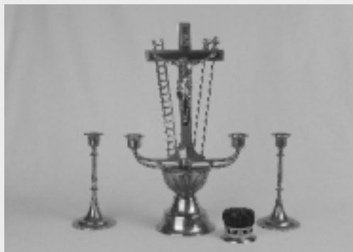
Abbildung einer sog. Vesehgarnitur, wie man sie früher in vielen Familien für die Krankensalbung eines Angehörigen aufbewahrte.

Von der letzten Ölung war früher oft die Rede, weil der Priester zumeist nur zu einem todkranken Menschen gerufen wurde. Man war der Auffassung, dieses Sakrament auch nur einmal, eben am Ende des Lebens, empfangen zu können.