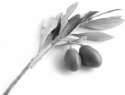
Der Ölzweig – Symbol für Frieden, Hoffnung und Lebenskraft

Du salbst mein Haupt mit Öl und füllst mir reichlich den Becher (Psalm 23,5). - Eine Salbung mit Öl wird seit alters her als belebende Wohltat empfunden. Im Mittelmeerraum wurde dem Öl aus den Früchten des Olivenbaums schon immer eine schützende, stärkende und heilende Kraft zugeschrieben. Eine Salbung mit diesem kostbaren Lebenselixier galt als Geste der Zuwendung und Wertschätzung. Im Alten Testament wurden Könige, Priester und Propheten gesalbt zum Zeichen ihrer Würde. Als Christen bekennen wir, dass Jesus der „Christus“ ist, der von Gott mit dem Heiligen Geist Gesalbte. Das Öl gehört neben Brot, Wein und Wasser zu den Urelementen christlicher Liturgie. Bei der Krankensalbung und der Firmung ist die Salbung Teil der sakramentalen Handlung. Als ausdeutendes Zeichen spielt sie eine wichtige Rolle bei der Taufe und beim Weihesakrament.