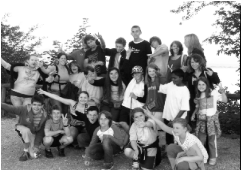
Mit den Minis beim Zelteln am Chiemsee 2008