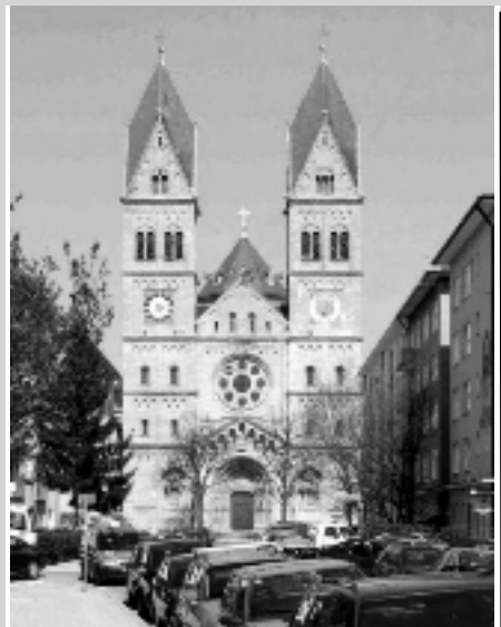
Gesamtansicht mit beiden Türmen

Anfangs waren die Uhren mechanisch, d.h. sie mussten etwa dreimal pro Woche aufgezogen werden, 1965 wurden sie elektrifiziert. Jetzt sind sie als Funkuhren eingerichtet, d. h. sie werden mit Funksignal elektronisch gesteuert. Das Gehwerk zeichnet sich aus durch seine Genauigkeit. Die Zifferblätter haben die Abmessungen 4x4m.