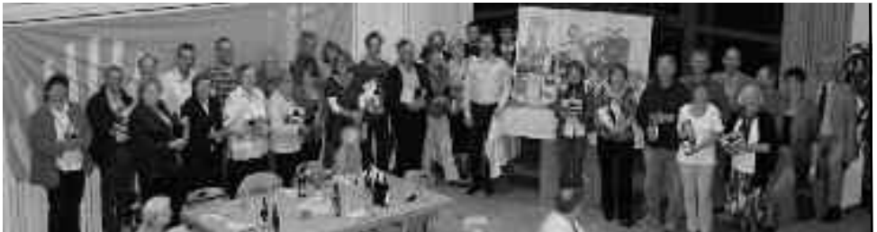
Ehrung der HelferInnen beim Ökumenischen Kirchentag