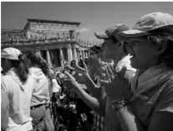
Großer Jubel bei der Papstaudienz

Den absoluten Höhepunkt erreichte die Wallfahrt dann am 04. August mit der Teilnahme an der Generalaudienz von Papst Benedikt XVI. Vor den 53.000 jugendlichen Pilgern würdigte der Papst den Einsatz der Jugendlichen am Altar und brachte seine Freude über die große Pilgerschar zum Ausdruck: „Ihr seid in großer Zahl hier! Ich habe mit dem Hubschrauber schon den Petersplatz überflogen und all die Farben und die Freude gesehen, die auf diesem Petersplatz zugegen ist. So sorgt ihr nicht nur für eine gute Stimmung auf diesem Platz, sondern vermehrt auch die Freude in