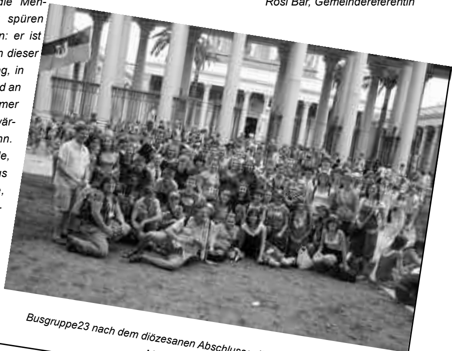
Busgruppe23 nach dem diözesanen Abschlussgottesdienst in St. Paul vor den Mauern